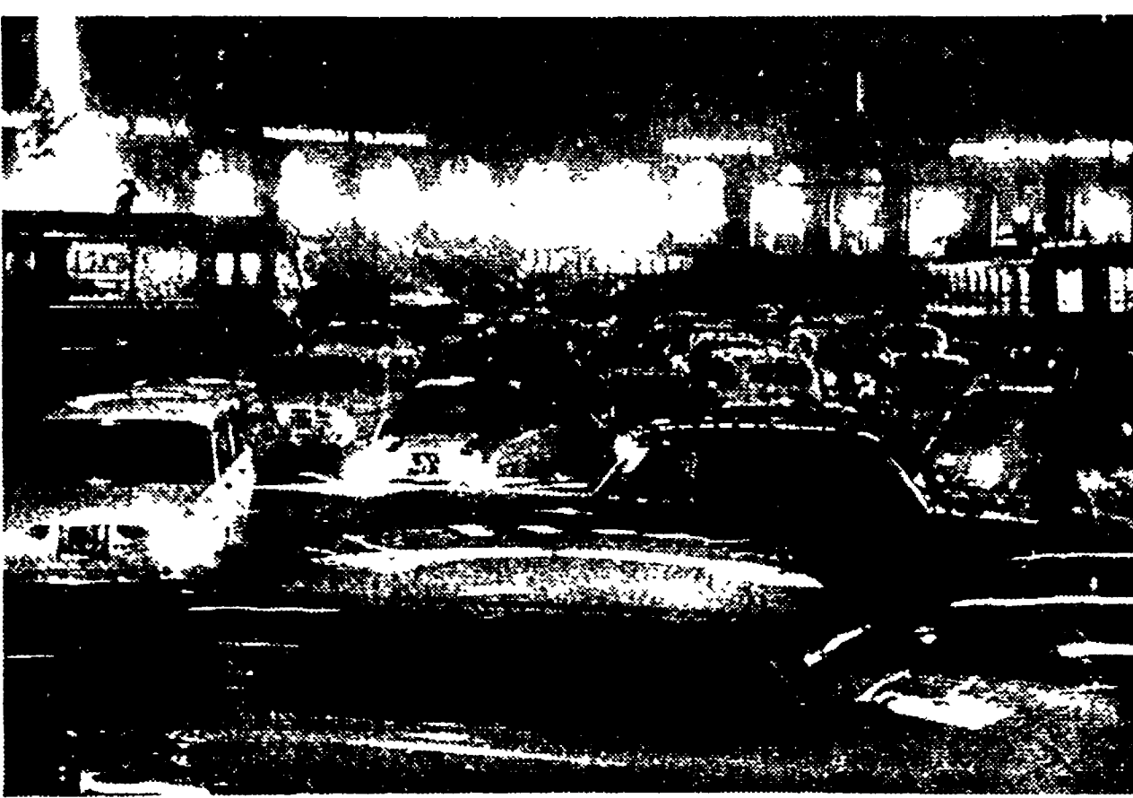
Piazza dell'Esedra: il caos da Porta Pia è dilagato a macchia d'olio in tutta la città.

Il caos è stato indubbiamente eccezionale, quale forse il centro di Roma non aveva mai visto. Tutta via Nazionale, piazza dell'Esedra, piazza dei Cinquecento e le strade che risalgono fino a Porta Pia e via Nomentana si sono paralizzate. Il blocco stradale è durato almeno tre ore, forse quattro. Ed è cominciato appena mezz'ora dopo la solenne cerimonia inaugurale: non appena il sottovia è rimasto sgombro di autorità, tutte le strade e i sottopassaggi si sono riempiti di automobilisti, assai meno felici ed entusiasti. E la retorica è andata in fumo in un battibaleno.